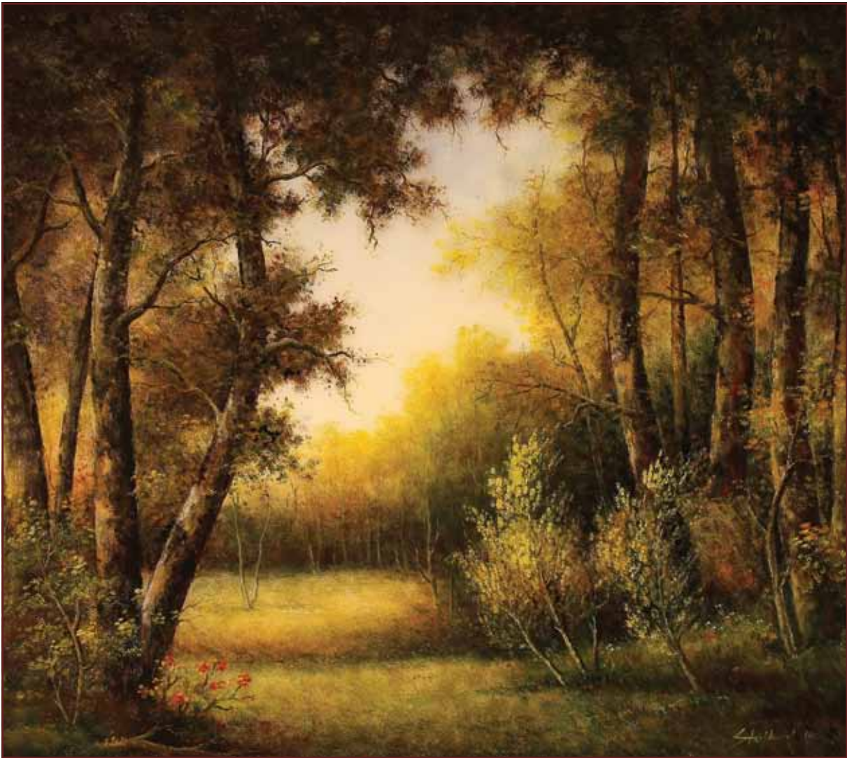
Šijakov gaj, 2010, 107x120