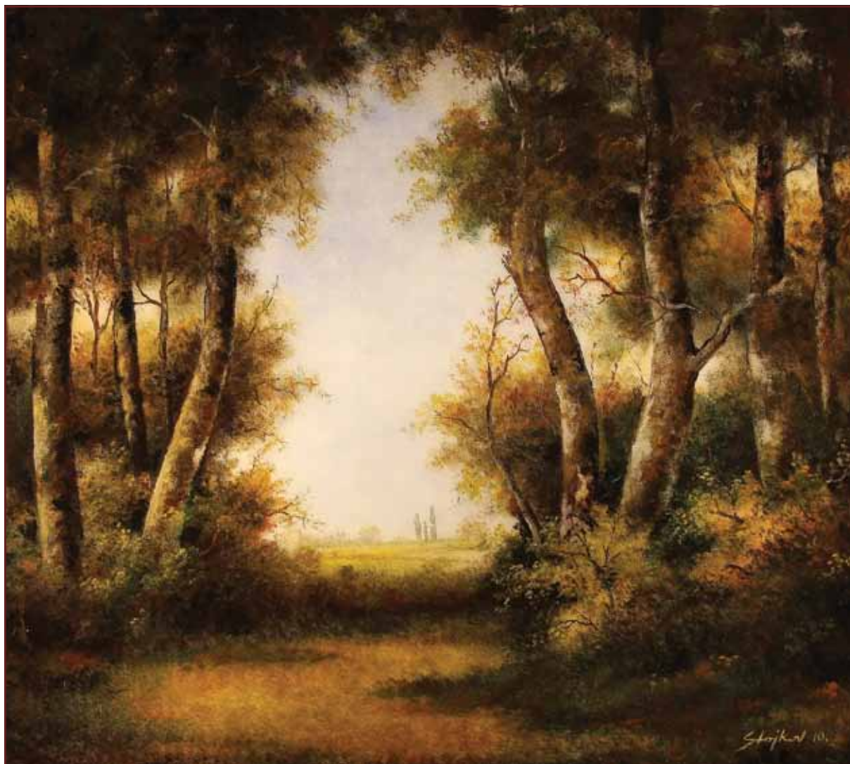
Šumica, 2010, 107x120