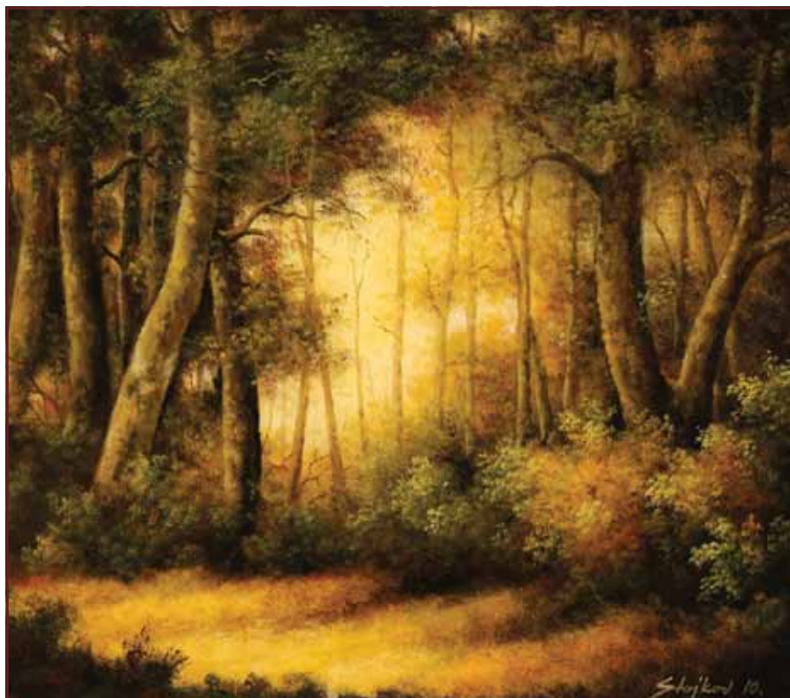
Maruškin proplanak, 2010, 70x80