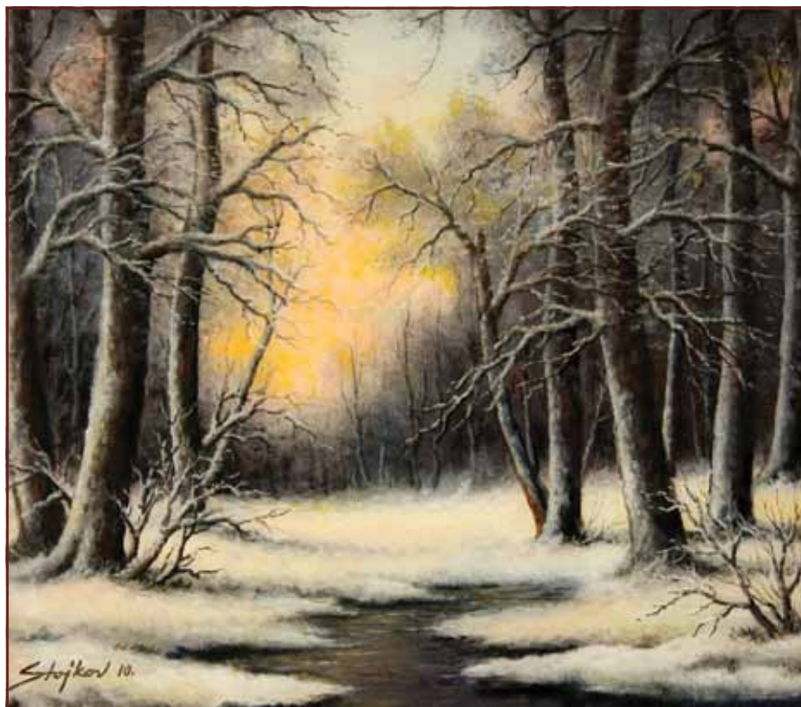
Zimski suton, 2010, 70x80