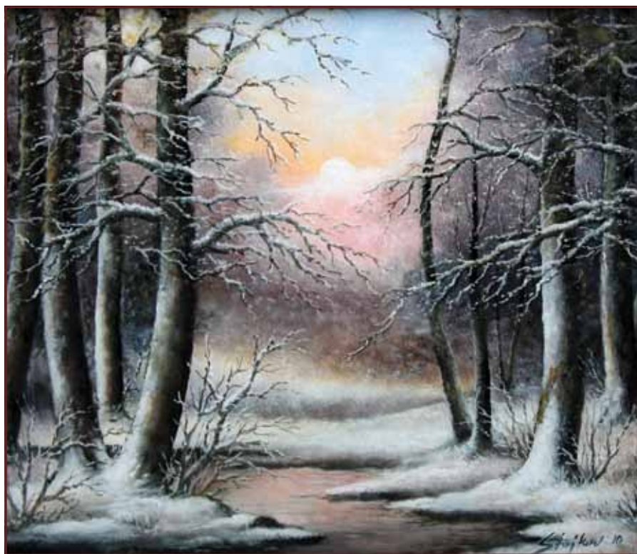
Zimsko veče, 2010, 70x80