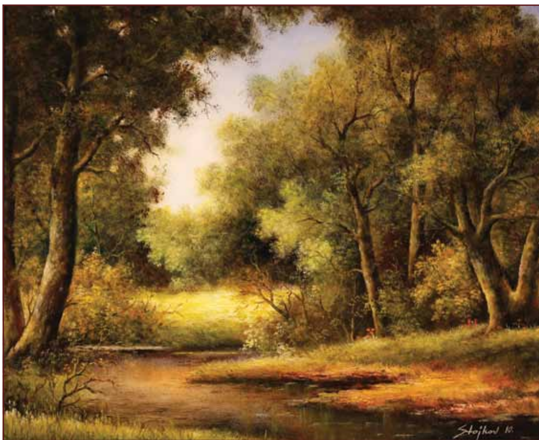
Lazarev gaj , 2010, 80x100