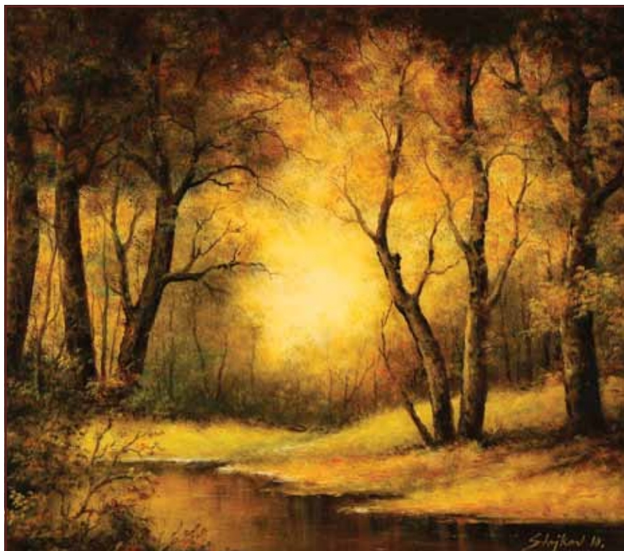
Dušanov šumarak, 2010, 70x80