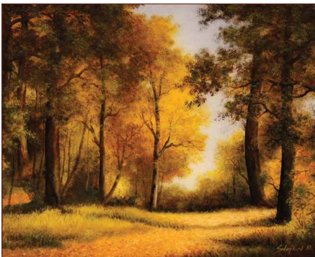
Jovanin šumarak, 2010, 80x100