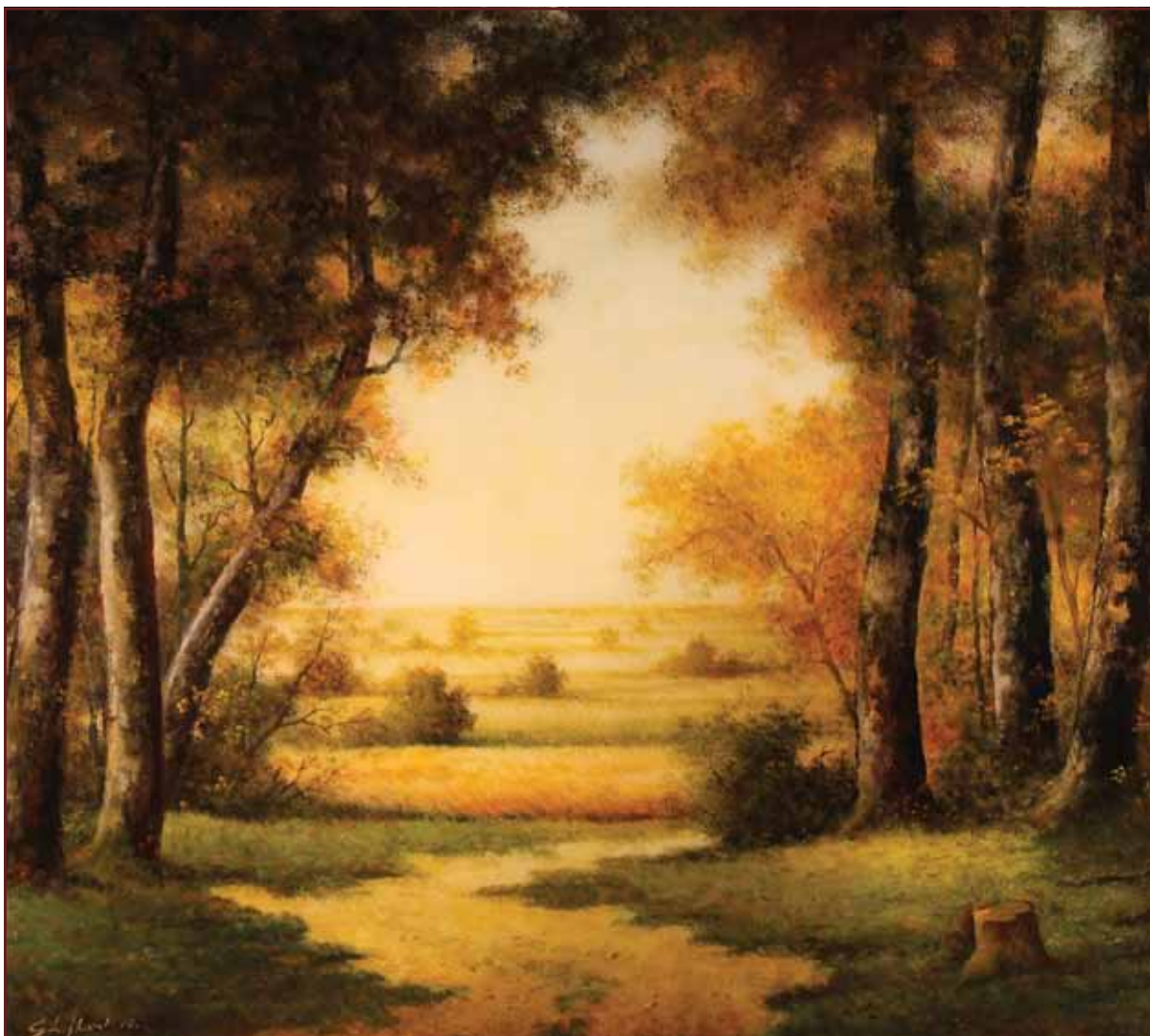
Šikara, 2010, 107x120