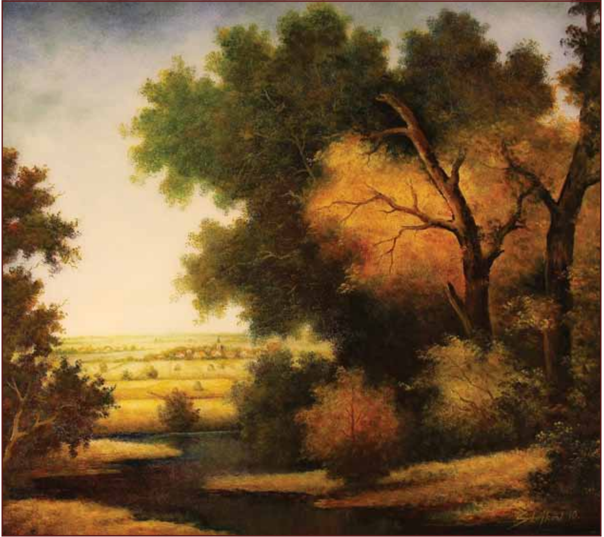
Šuma kraj sela, 2010, 107x120