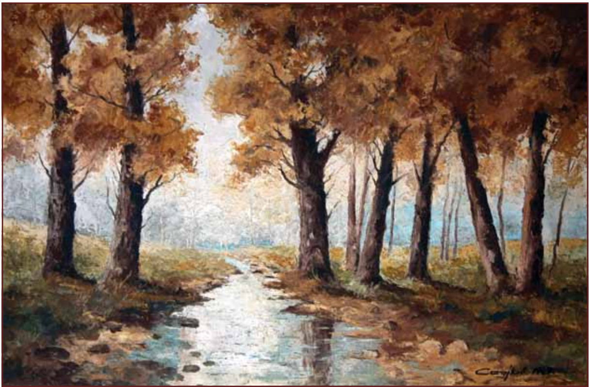
Šuma i potok, ulje na lesonitu, 1949, 90x140