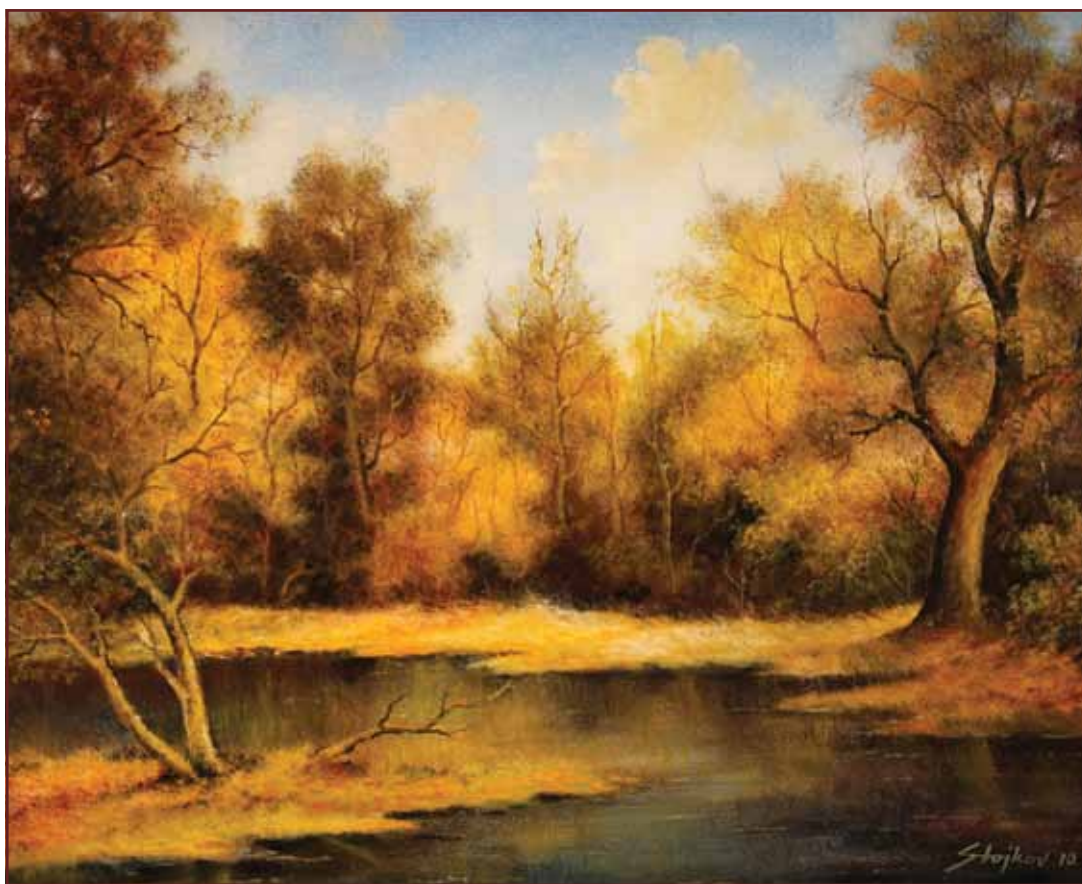
Vidrak u šumi, 2010, 80x100