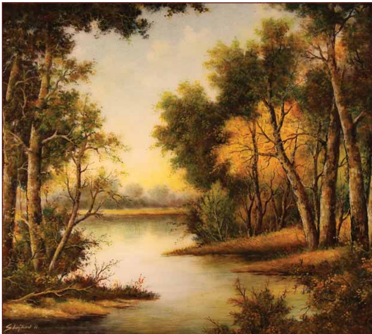
Potok u šumi , 2010, 107x120