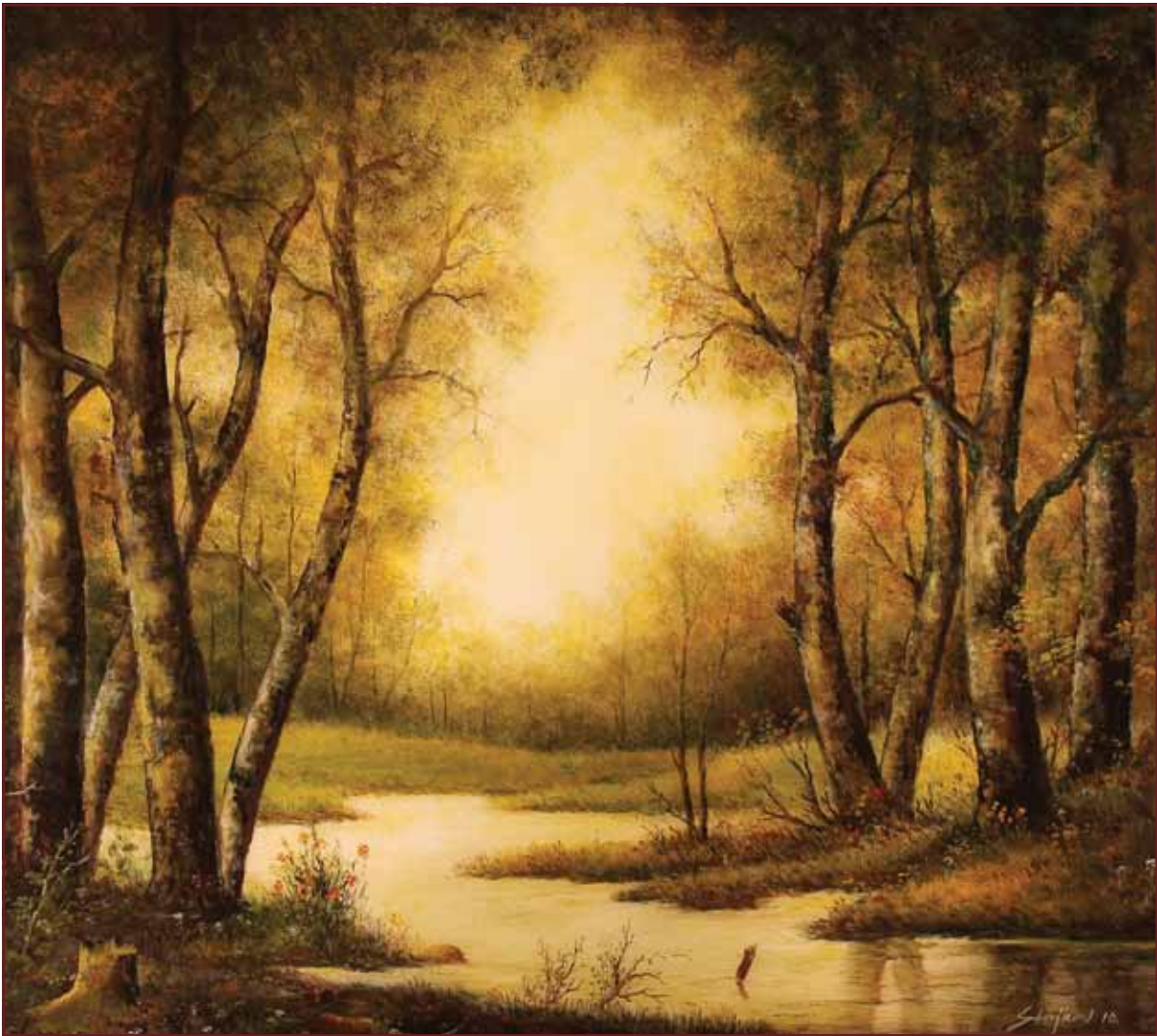
Proplanak, 2010, 107x120