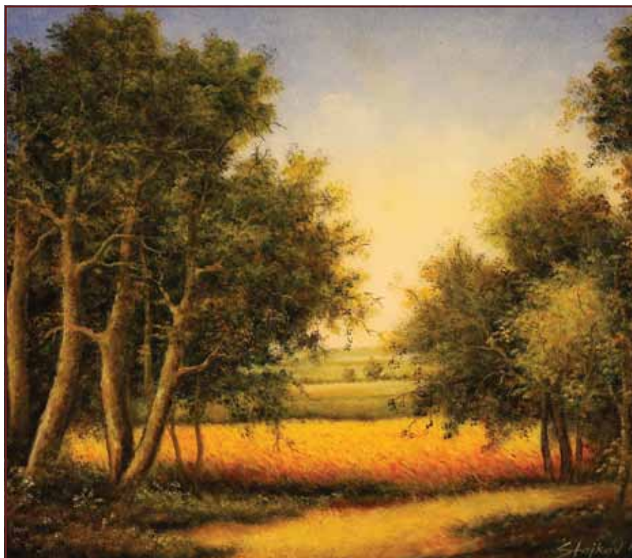
Ovratina pored šume, 2010, 70x80