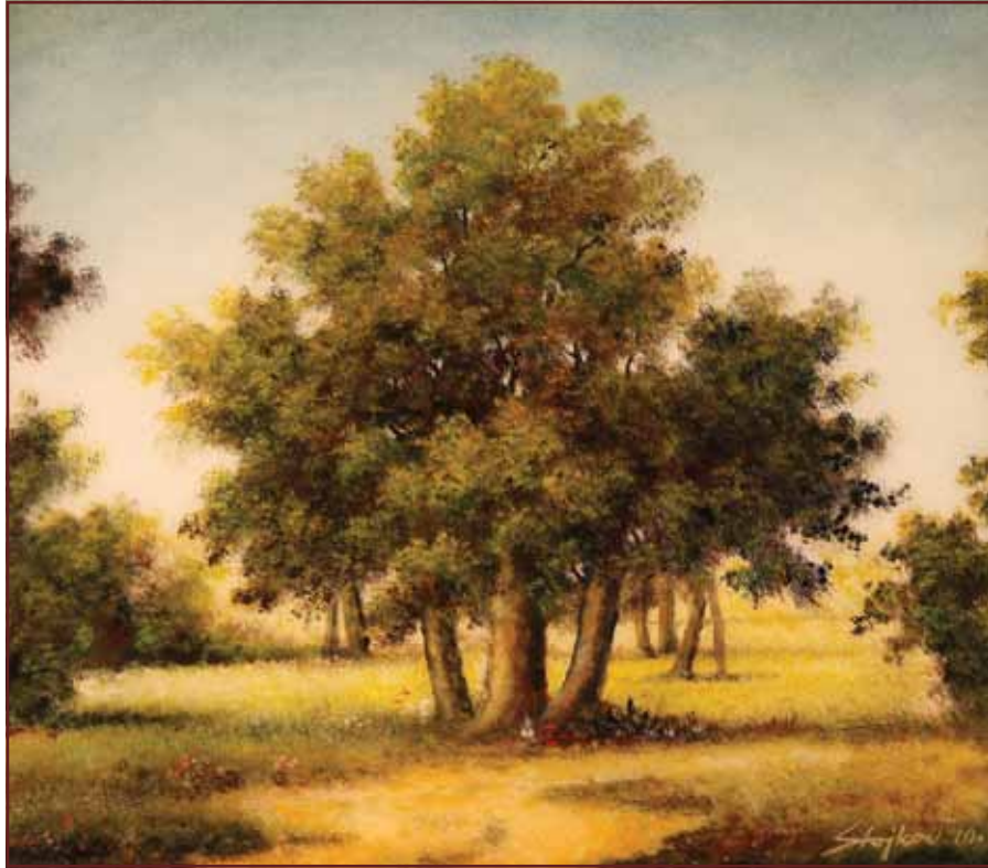
Usamljeni hrast, 2010, 70x80