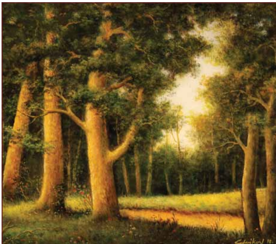
Bodroška šuma , 2010, 70x80