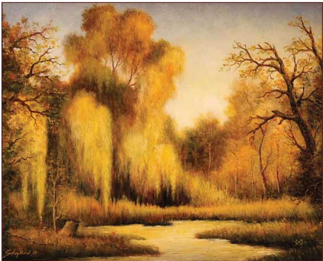
Vrbak u jesen, 2010, 80x100