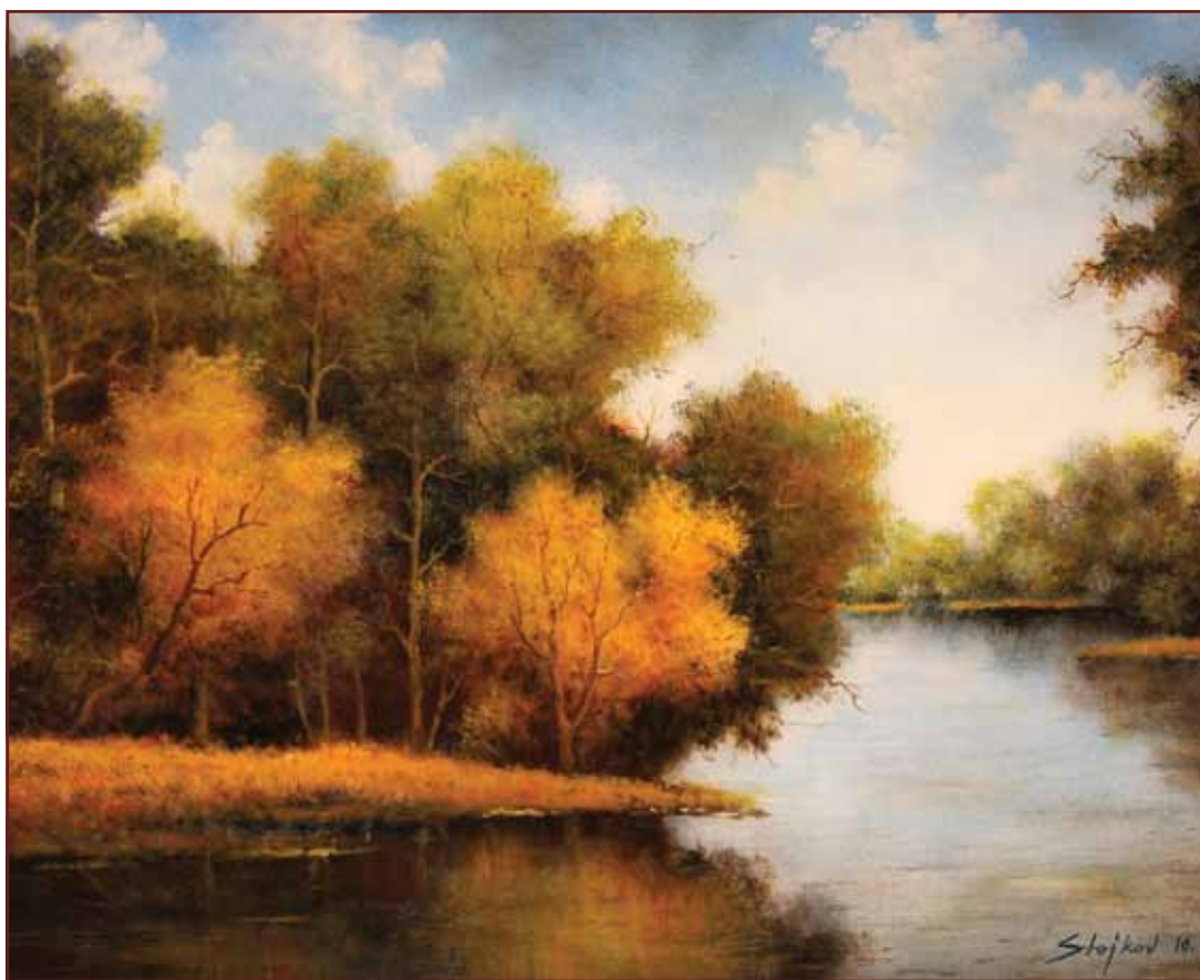
Kraj Mostonge, 2010, 80x100