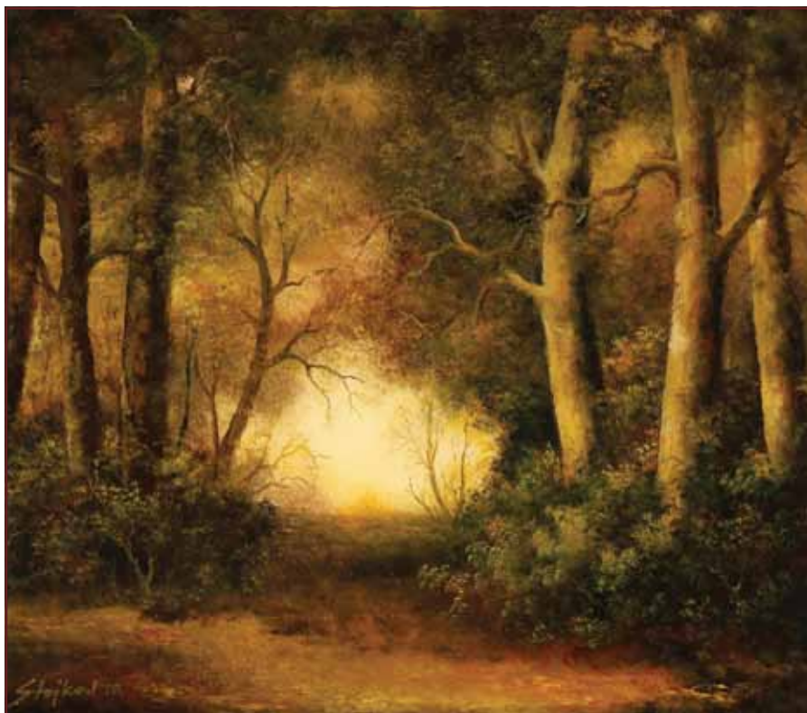
Bukovačka šuma, 2010, 70x80