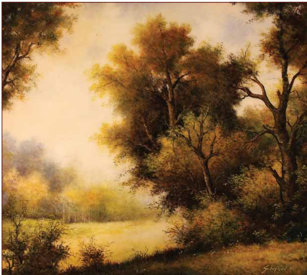
Jesen, 2010, 107x120