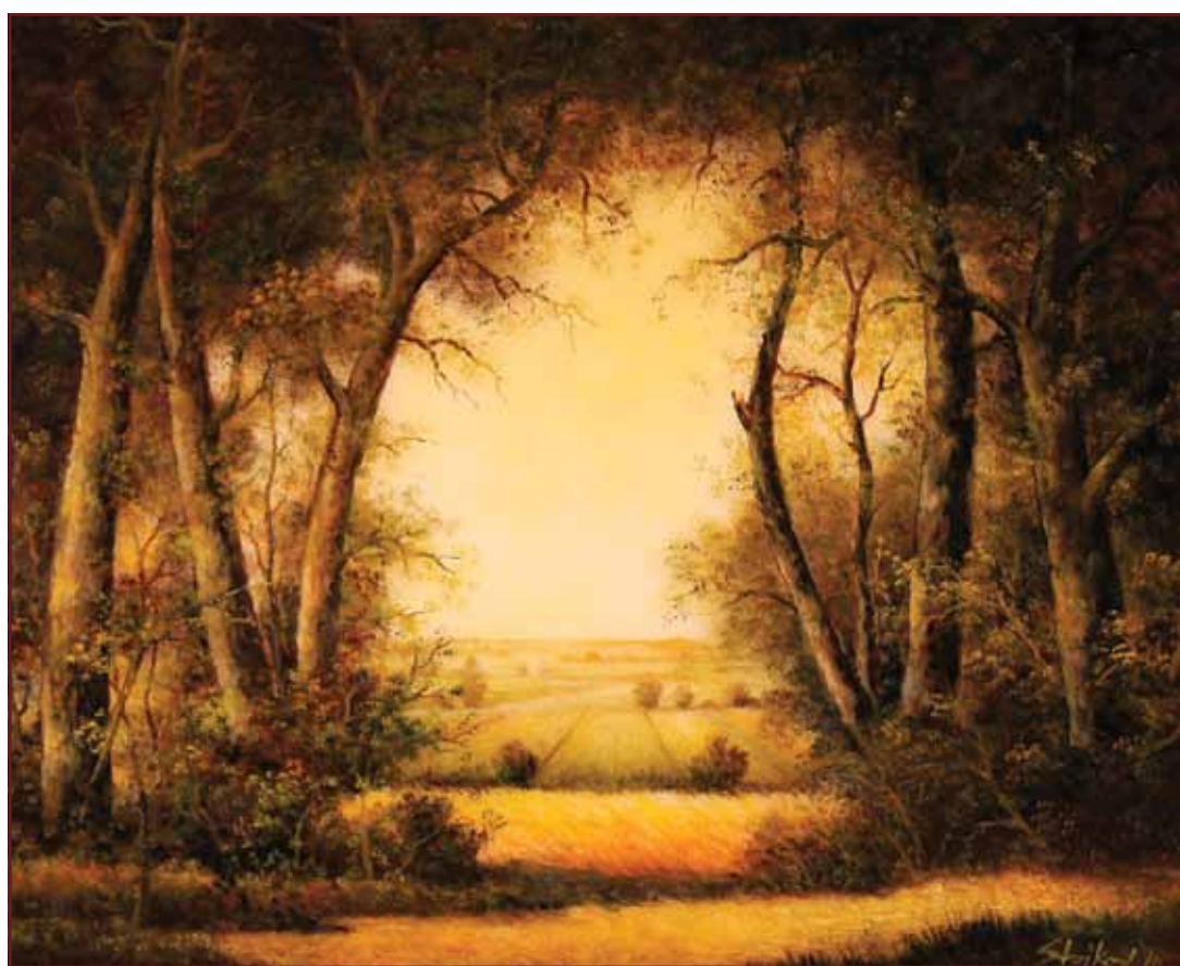
Šikara, 2010, 80x100