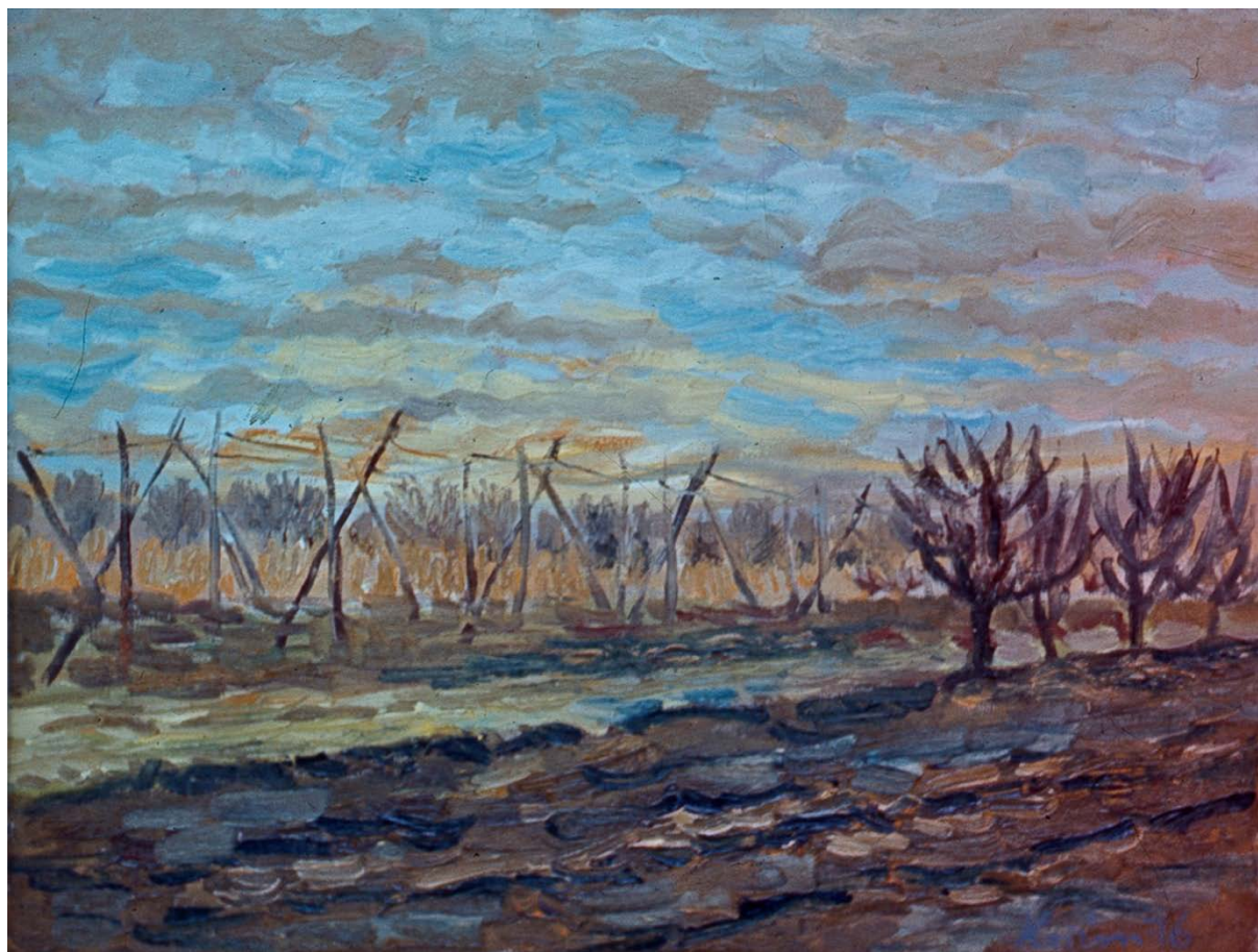
Chmelnica v jeseň (olejomalba)

a chotára s divými makmi. Kus už nenávratne zanikajúceho sveta, z ktorého autor vyrástol a na ktorý sa díva so široko roztvorenými očami na svojich potulkách za krásou. Je v tom svete na Križanových obrazoch čaro poézie, ktoré uchvacuje.