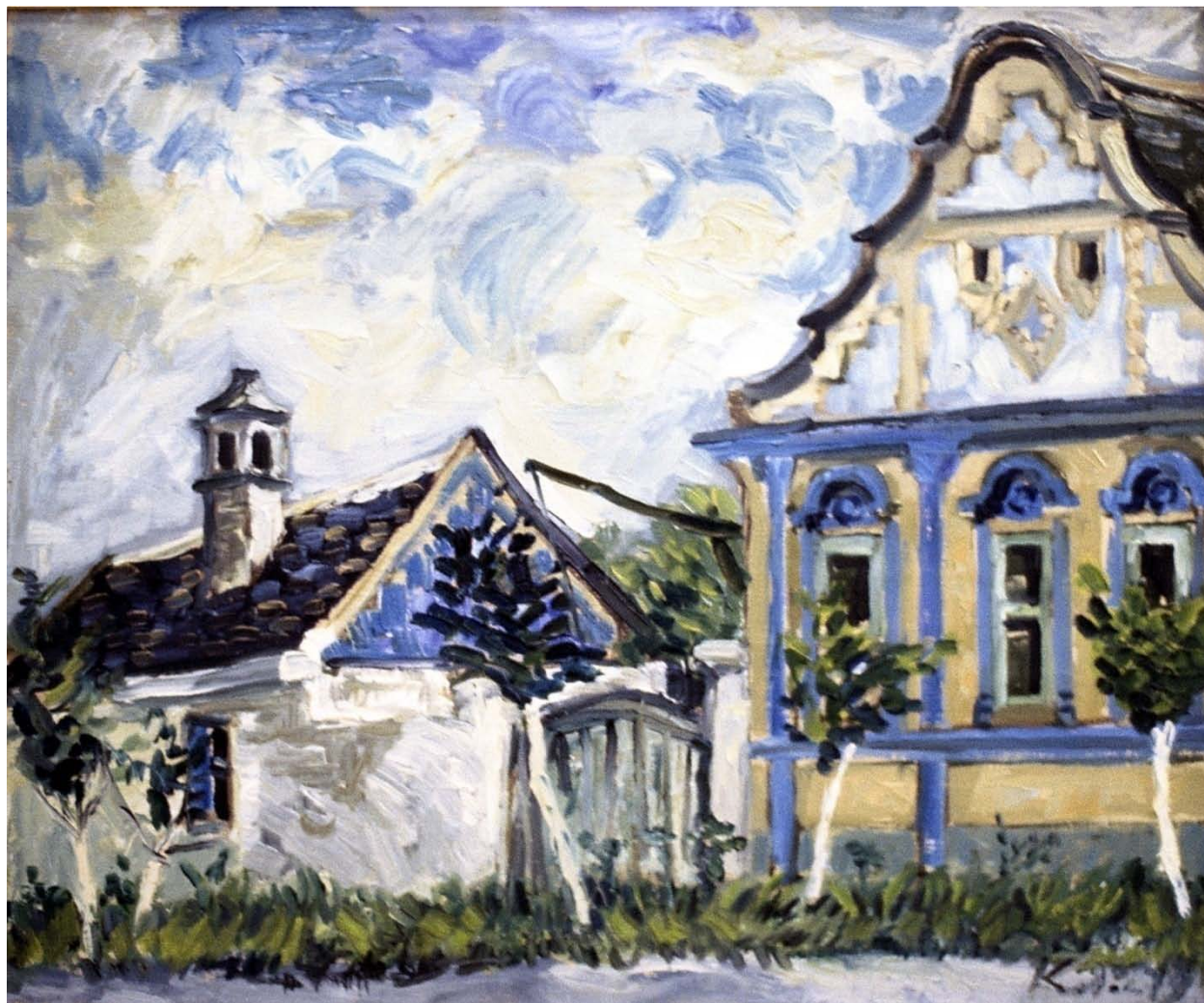
Dom modro žltý v Kulpínskej ulici (olejomalba)