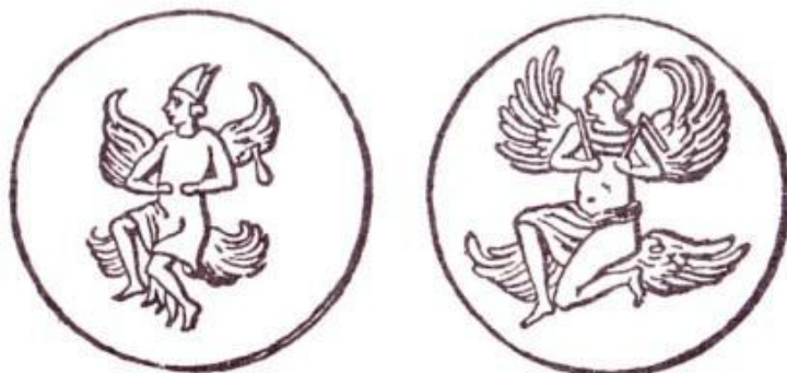
Pagan Maltese coins.

Staré mince z Malty, z obdobia pohanstva, tiež znázorňujú okrídlené božstvá s mitrou na hlave.