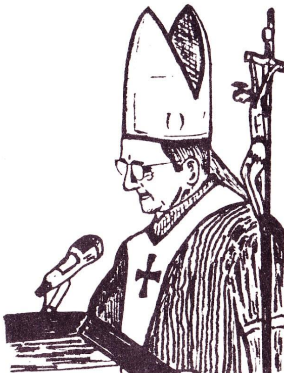
Pope Paul VI wearing mitre.

Do akej miery mitraizmus ovplyvnil kresťanstvo, nedá sa povedať. Vedci poukazujú na zrejmé príbuzenstvo, kým cirkev sa všemožne snaží všetko poprieť, „zahrať“, vyvrátiť... lenže majme na zreteli, že mitraizmus je o aspoň 2000 rokov starší, od kresťanstva a že počas svojej existencie ovplyvnil aj Babylónsko... ba aj chápania Hebrejcov, Židov.